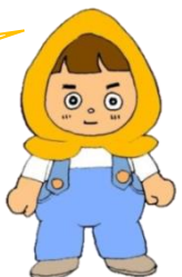
防災教育事業の イメージキャラクター