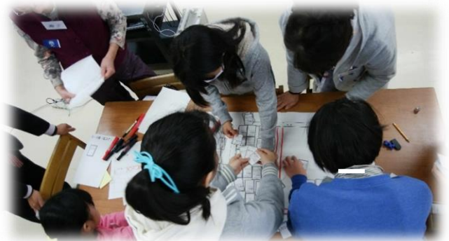
地域の方と一緒に避難所運営ゲームで学ぶ 一本松小学校の6年生(昨年度発表校)