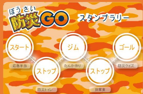
スタンプラリー台紙