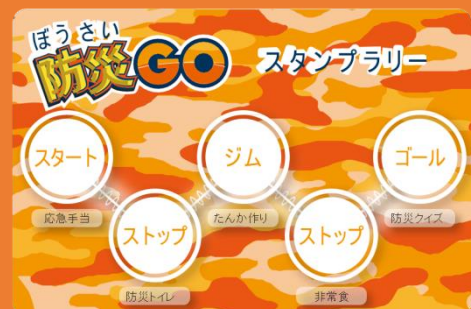
スタンプラリー台紙